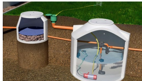
Gartenbewässerung mit dem LKT- Gartenmodul