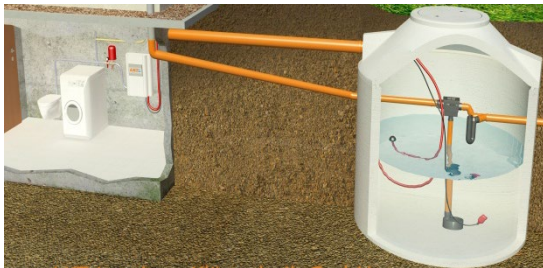
Hauswassernutzung mit dem LKT.Modul

Mit Hilfe verschiedener Technikmodule, können Sie ihr Regenwasser unter anderem für die Gartenbewässerung oder die Toilettenspülung nutzen.